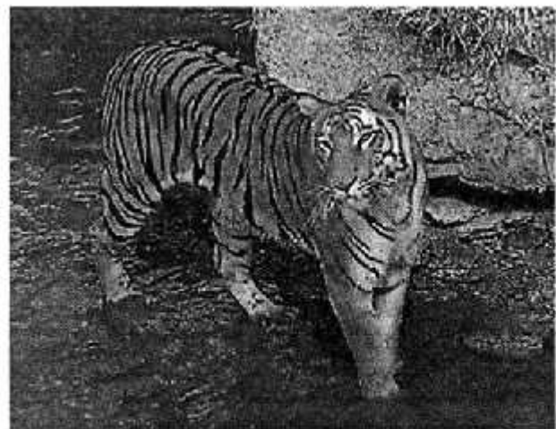
कान्हा का बाघ