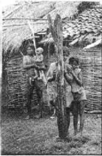
कान्हा के लोग दूसरी जगह में