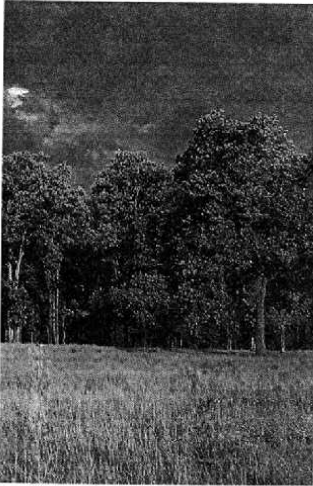
कान्हा के जंगल और मैदान

जानवर रहते थे— मगर इनमें सबसे शानदार जानवर बाघ था। कान्हा के जंगलों में कई साल पहले तक सैकड़ों बाघ थे। इतने सारे बाघ किसी जंगल में तभी रह पाएँगे जब दूसरे जानवर और भी ज्यादा हों जैसे— चीतल, गौर या जंगली भैंसा, सांभर, बारासिंगा, लंगूर आदि। आखिर ये सब ही तो बाघ के भोजन हैं। और ये सब दूसरे जानवर तभी पलेंगे जब वहाँ घना जंगल व घास रहे।