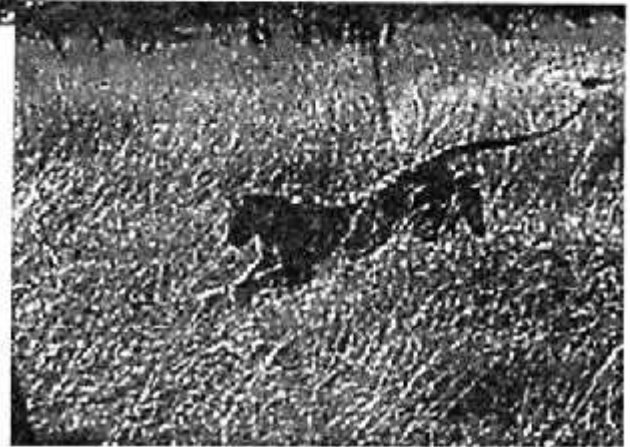
दौड़ता हुआ शिकारी बाघ

बढ़ता है कि हवा जानवर से उसकी दिशा में बह रही हो ताकि जानवरों को उसकी गंध न मिल पाए। वह दबे पाँव, धीरे-धीरे, लगभग खिसकता हुआ जानवर के पास तक पहुँच जाता है। फिर मौका देखते ही अचानक, बिजली की तेजी से छल्लाँग लगाकर जानवर पर हमला करता है। जानवर को एहसास तक नहीं हो पाता। कुछ ही देर में जानवर मर जाता है।