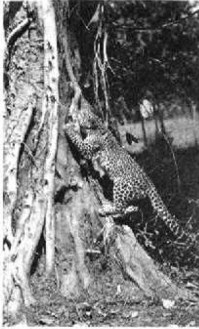
पेड़ पर चढ़ता हुआ तेंदुआ

जानवरों के लिए, तालाबों, डबरों, नालों में साल भर पीने का पानी रहे। पानी के साथ जानवरों को नमक की भी ज़रूरत होती है। तो पानी के पास ही नमक के छोटे-छोटे टीले बना दिए जाते हैं।