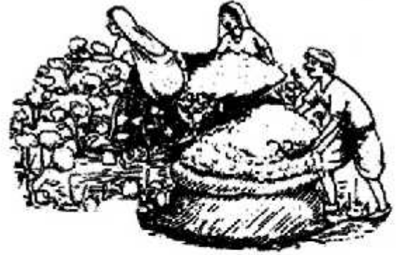
कपास चुनकर बोरो में भरते हुए

पश्चिमी इलाके के कुछ हिस्सों में कपास महत्वपूर्ण फसल है। कपास ऐसी जगह पर अच्छी होती है जहाँ बरसात बहुत ज्यादा नहीं होती। पर इसे बोने का समय बरसात शुरू होने पर ही होता है। परंतु जड़ को पानी तो चाहिए ही इसलिए कपास के लिए काली मिट्टी, जिसमें नमी रखने की क्षमता अधिक होती है, बढ़िया होती है। सितंबर तक खेत में सफेद कपास चुनने के लिए तैयार हो जाती है। पकते और चुनते समय अगर बारिश हो जाए तो फसल को नुकसान हो जाता है।