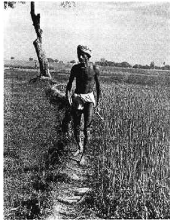
अपने गेहूँ के खेत को निहारता किसान

कुछ जगहों पर इसी समय चना भी उगाया जाता है।