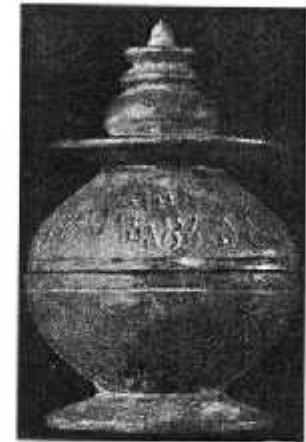
अस्थियों का डिब्बा

स्तूप की तस्वीर देखकर उसके बारे में लिखो। अपनी कॉपी में उसका विवरण लिखो।