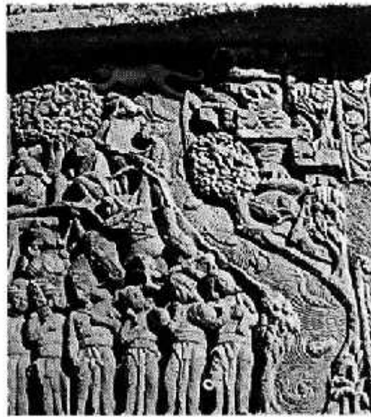
स्तूप के पश्चिम के तोरण द्वार पर गौतम बुद्ध के बारे में इस कहानी का चित्र बना है

एक पेड़ से दूसरे पेड़ तक पुल कैसे बनाया गया होगा इसका चित्र बनाओ। पत्थर पर यही कहानी खोदी गई है। इस चित्र में दूँहों कहाँ क्या हो रहा है।