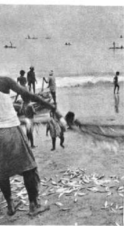
पूर्वी तट का एक दृश्य

में धान की खेती अच्छी होती है। यह इसलिए भी हो पाता है क्योंकि भारत के पूर्वी तट पर भी ज़्यादा बारिश होती है।