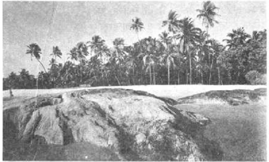
कर्नाटक का समुद्र तट

हैं। इनमें सैकड़ों बैलगाड़ी भरकर सामान आ सकता है। यहाँ तक कि भारी मशीनें और मोटर गाड़ियाँ भी आ जाती हैं। बंदरगाह पर सामान उतारकर फिर रेलों और ट्रकों से देश के अन्य भागों को भेजा जाता है। फिर इन्हीं जहाजों पर लाद कर अपने देश का सामान अनाज, कपड़े, लोहा, कोयला, तेल अन्य देशों को जाता है। इस तरह मुम्बई बंदरगाह से खूब व्यापार होता है।