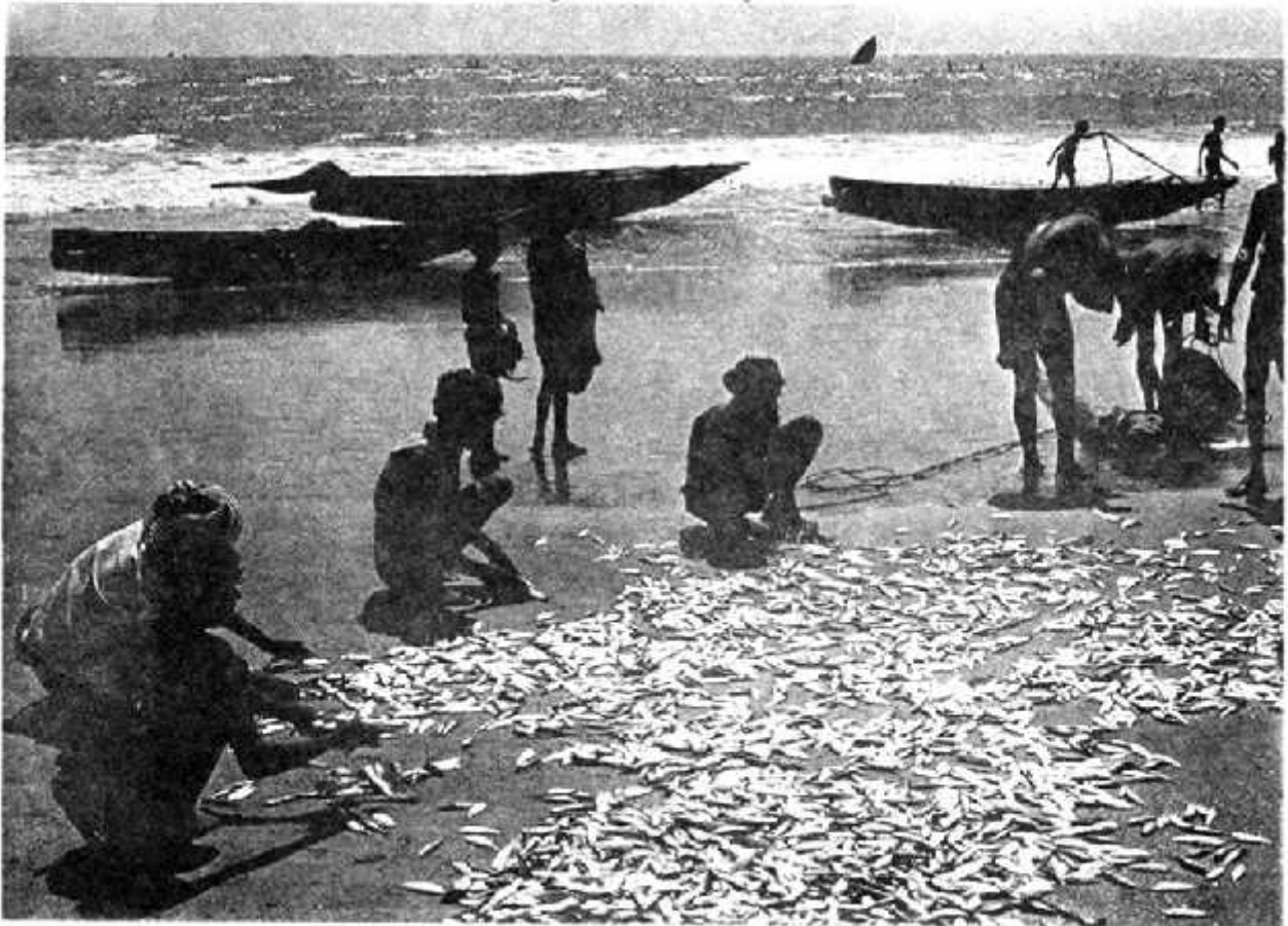
भारत का समुद्र तट

याद है, तुम पिछले साल नर्मदा नदी के साथ यात्रा करते हुए समुद्र तट पर पहुँच गए थे? तो चलो समुद्र तट से ही अपनी सैर शुरू करते हैं। क्या तुमने कभी समुद्र देखा है? असल में न सही पर चित्रों में या टी.वी. पर शायद देखा हो। शायद समुद्र के बारे में किसी पाठ या किसी कहानी में पढ़ा हो।