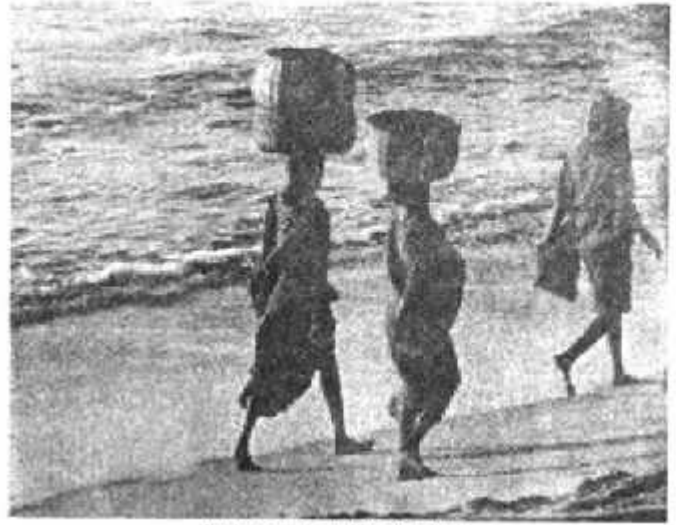
समुद्र तट का एक दृश्य

अपना राज्य समुद्र से काफी दूर है इसलिए अगर तुम्हें समुद्र देखना है तो गुजरात या दक्षिण भारत के अन्य राज्यों में जाना होगा। भारत का दक्षिणी भाग तीन ओर से समुद्र से घिरा हुआ है।