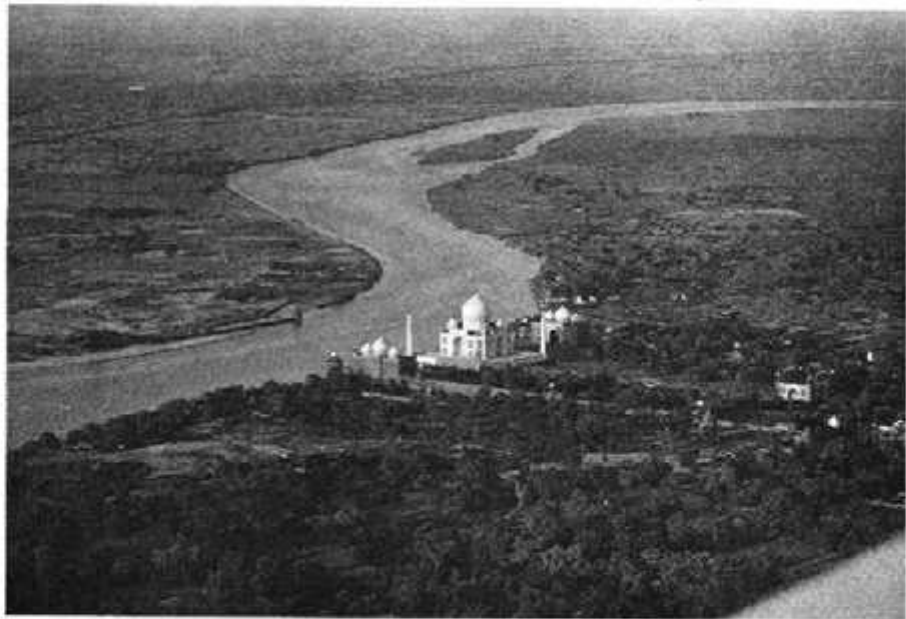
आगरा के पास यमुना नदी के किनारे का एक दृश्य

4. नक्शा नं 2 में देखो—हिमालय पर्वत के दक्षिण में एक विशाल मैदान है। यही सतलज-गंगा नदियों का मैदान है। इसे उत्तर का मैदान भी कहा जाता है।