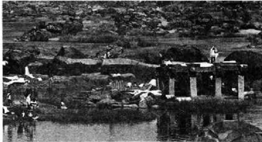
दक्कन की ऊबड़-खाबड़ ज़मीन में हम्पी इलाके की एक नदी

तुमने नक्शे और चित्रों में भारत के तट, नदियों, पहाड़ियों के नजारे देखे। तुममें से कुछ बच्चों ने शायद टी.वी. या अखबारों में इनमें से कुछ जगहों को देखा होगा। अगली बार तुम ऐसे चित्र देखो तो यह पता करने की कोशिश करना कि वह जगह कहाँ है।