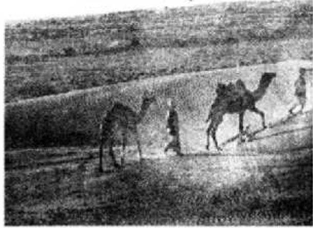
रेगिस्तान का एक दृश्य

भारत में एक ऐसा इलाका है जहाँ बारिश बहुत ही कम होती है। वहाँ दूर-दूर तक रेत या चट्टानें फैली दिखती हैं और बहुत कम पेड़-पौधे नजर आते हैं। यह रेगिस्तान का इलाका है और 'थार मरुस्थल' के नाम से जाना जाता है। अरावली पहाड़ों के पश्चिम में जाने पर हम थार का मरुस्थल देख सकते हैं। यहाँ लोग भेड़, बकरियाँ और ऊँट पालते हैं।