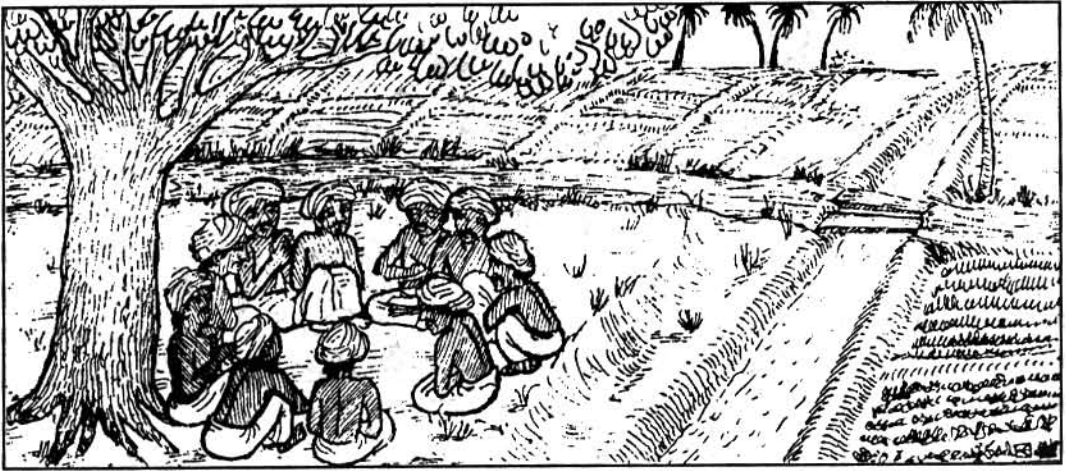
ऊर सभा की बैठक हो रही है

आज से एक हजार वर्ष पूर्व तमिलनाडु के गांवों में एक व्यवस्था थी। वहां के हर गांव में किसानों की एक सभा (समिति) होती थी जिसे “ऊर” कहा जाता था। ऊर में गांव के प्रमुख किसान सदस्य थे। यही ऊर गांव के सब कामकाज चलाती थी- लोगों के बीच झगड़े निपटाना, अपराधियों को दण्ड देना, ज़मीन का लेखा-जोखा हिसाब-किताब रखना, नहर के पानी का बंटवारा करना आदि। ऊर का एक और महत्वपूर्ण काम था- किसानों से लगान वसूल करके राजा तक पहुंचाना। दक्षिण भारत में गांव के किसानों की सभा ऊर ही, किसानों से लगान वसूल कर के राजा को देती थी।