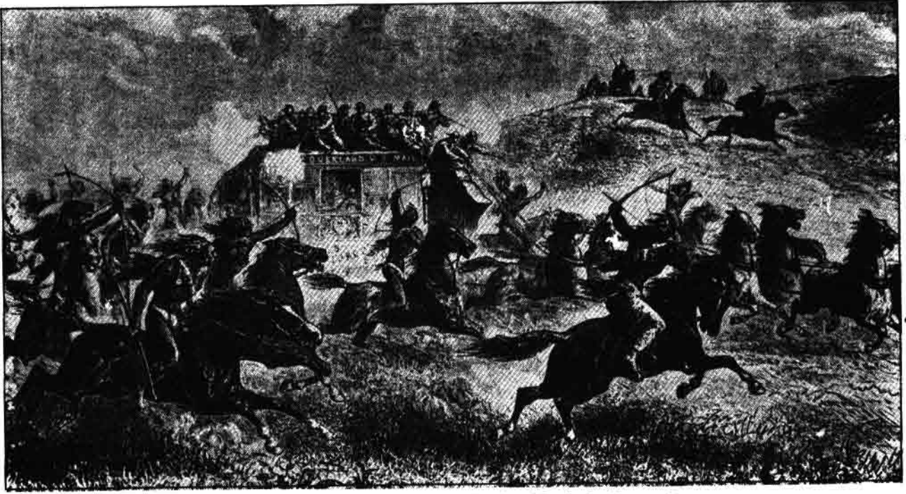
नये बसने आ रहे यूरोपियनो और आदिवासी अमेरिकनो के बीच लड़ाई

खत्म हो रहा था। उन्होंने जम कर यूरोपियनो से लड़ाई की। कई खूनी लड़ाइयां हुईं पर अंततः आदिवासी अमेरिकनो को हार माननी पड़ी।