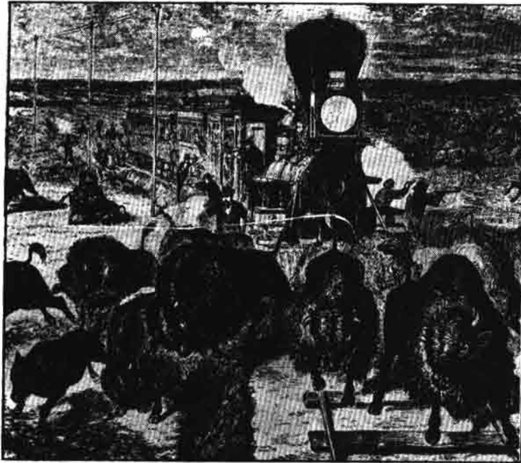
इस तरह लाखों बाइसन मारे गये

नई और खुली जगहें तलाश करने लगे। ज़मीन की तलाश में लोगो ने अपलेशियन पर्वत श्रेणी पार की और मिसिसिपी नदी के मैदान में बसना शुरू कर दिया। वहां के जंगल काटने लगे और खेत बनाने लगे। मिसिसिपी नदी के मैदान में बसे आदिवासियों को फिर लड़ाइयो और समझौतो के ज़रिए हटाया गया।