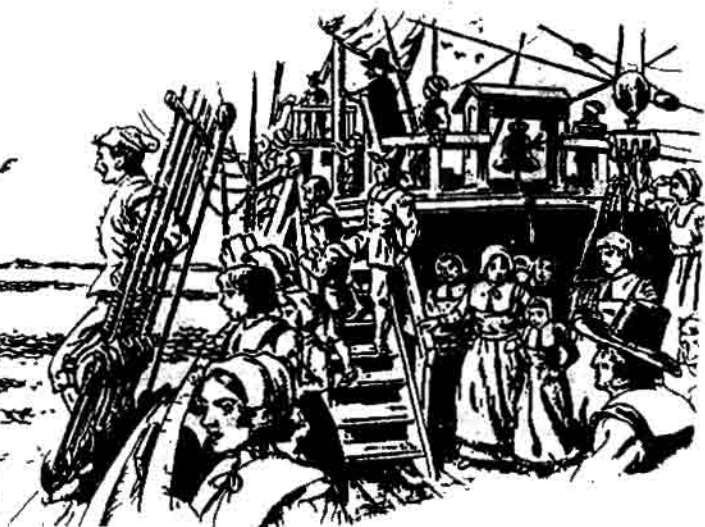
अमेरिका में यूरोप के लोग बसने आए

यूरोप में उन दिनों जनसंख्या तेजी से बढ़ रही थी। लोग अधिक थे और खेतिहर ज़मीन कम। इसका फायदा यूरोप के बड़े ज़मींदार उठा रहे थे। वे किसानों से अधिक लगान मांगने लगे थे। ऐसे हालात में, जब यूरोप के लोगों ने सुना कि उत्तरी अमेरिका में ज़मीन खाली है तो वे अमेरिका की ओर चल पड़े। कई गरीब किसान ज़मीन के लालच में आए। कई व्यापारी व्यापार और धंधे के नए मौके ढूँढने के लिए अमेरिका आए।