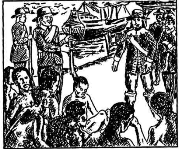
शुरू में अफ्रीका से लाए गए दास

दासों की मारपीट, यातना देना और यदि भागे तो मार देना आम बातें थीं। दासों के जो बच्चे होते वे भी उसी मालिक के दास होते, या मालिक को