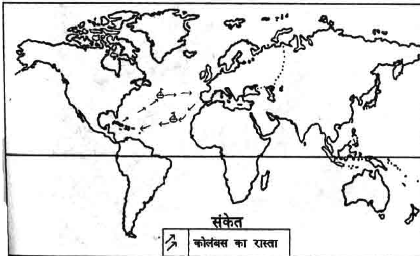
विश्व का मानचित्र

इन महाद्वीपों के बीच संपर्क आज से 400 वर्ष पूर्व ही बना और वह भी संयोग से।