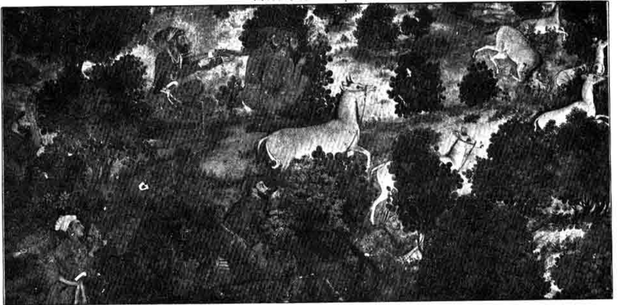
शिकार करता औरंगज़ेब

शिवाजी महाराष्ट्र में अपना राज्य बनाने में सफल हुआ। पर उसे अपना राज्य बढ़ाने के लिए लगातार