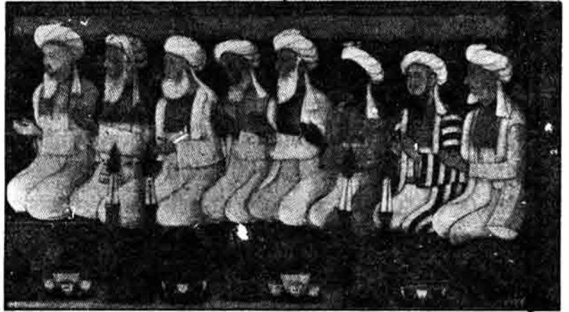
मुगल दरबार में परंपरावादी मौलवी

पर हिंदू लोगों का समर्थन भी उसे चाहिए था। वह खासतौर से राजपूतों और मराठों को अपने साथ करना चाहता था। उसने बहुत बड़ी संख्या में मराठों को अपने शासन में पद दिये। उसने राजपूत अमीरों को भी खूब तरक्की दी। उन्हें साम्राज्य के महत्वपूर्ण पद दिए। राजा जय सिंह और महाराजा जसवंत सिंह