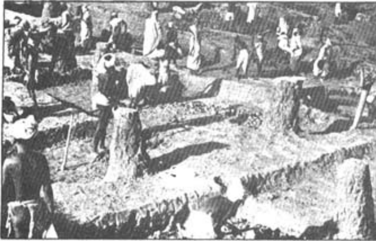
रोज़गार कार्यक्रम में सड़क के लिए मिट्टी की खुदाई

1989 में इन दोनों रोज़गार कार्यक्रमों को जोड़कर एक नया कार्यक्रम शुरू किया गया - जवाहर रोज़गार योजना कार्यक्रम। इस कार्यक्रम का भी उद्देश्य है कि गांव के ग़रीब लोगों को अधिक रोज़गार मिले। इस कार्यक्रम में नई बात यह है कि इसे चलाने के लिए पैसा सीधे पंचायत को दिया जाता है। पंचायत को तय करना है कि इस कार्यक्रम के अंतर्गत क्या काम किया जाना चाहिए। गांव के लोग अपने हिसाब से योजना बनवाते हैं और काम करवाते हैं।