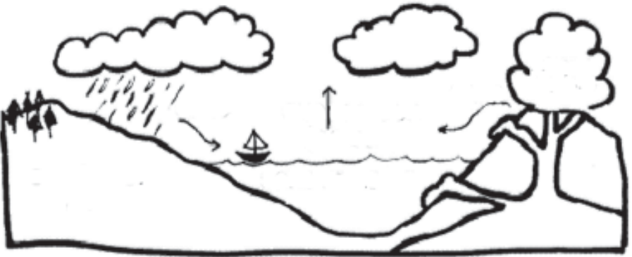
चित्र-1: समुद्र में लवण के स्रोत।

इस सवाल का जवाब खोजने का एक रोचक तरीका यह होगा कि हम यह विचार करें कि करोड़ों वर्षों पहले हमारे समुद्रों और महासागरों की स्थिति क्या थी क्योंकि शुरुआत में समुद्र नमकीन नहीं थे।