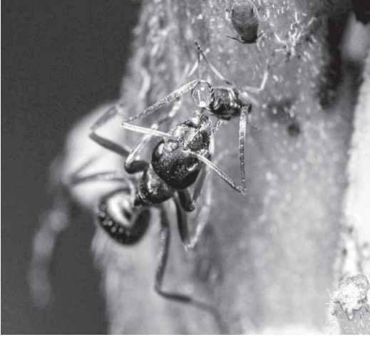
चित्र-2: कुछ चींटियाँ माहू द्वारा स्रावित हनीड्यू का सेवन करती हैं।

उपस्थित कुछ वाष्पशील कार्बनिक यौगिकों (VOC) की उपस्थिति को अपने संवेदी अंगों (घ्राण बल्ब) की मदद से 'सूँघ' लेती हैं। घ्राण बल्ब हमारी नाक की तरह काम करते हैं (देखें बॉक्स 2)।