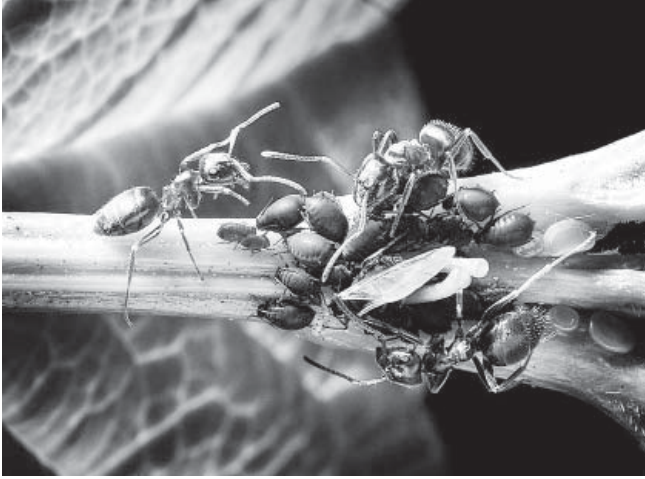
चित्र-3: कुछ चींटियाँ माहूओं को उनके कुदरती शत्रुओं से बचाती हैं। यह अन्तर्क्रिया सहजीविता का एक उदाहरण है।

हनीड्यू से पूरा किया जा सकता है) से अधिक हो जाती है। ऐसी परिस्थिति में माहू-चींटी अन्तर्क्रिया सहजीवी न रहकर, शत्रुवत किस्म की हो जाती है। अलबत्ता, अध्ययन यह भी दर्शाते हैं कि चींटियाँ ऐसी माहू प्रजातियों का शिकार करना ज़्यादा पसन्द करती हैं जो गैर-वल्मरागी (non-myrmecophilous) हों, बनिस्वत