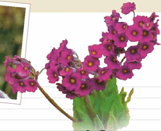
प्रस्तुति: स्निग्धा दास