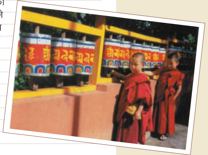
दो-दरुल-चोरटन और उसमें चक्कर घुमाते बौद्ध लामा