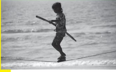
हास्यास्पद गरीबी रेखा