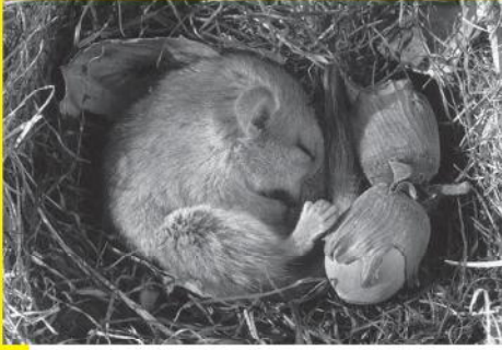
ठंड से बचाव का तरीका - शीतनिष्क्रियता