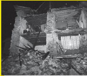
भूकंप व दुर्गम पर्वतीय गांवों में बचाव कार्य