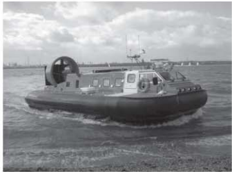
भविष्य का जल-थल वाहन होवरक्राफ्ट