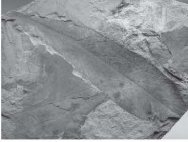
जैव विकास: भविष्य की राहें