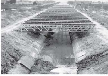
खेतों में फसल के साथ सौर ऊर्जा उत्पादन