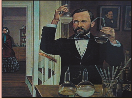
14 सूक्ष्मजीव विज्ञान के तीन सुनहरे युग