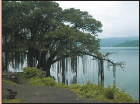
19 भारत के प्राचीन वृक्ष