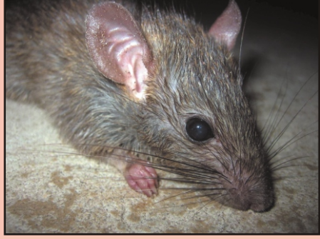
12 मोटापा घटाना चूहों से सीखें