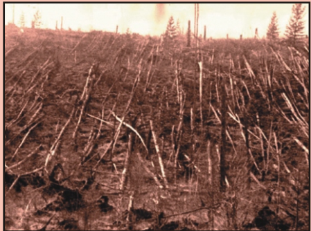
28 तुंगुस्का की पहेली